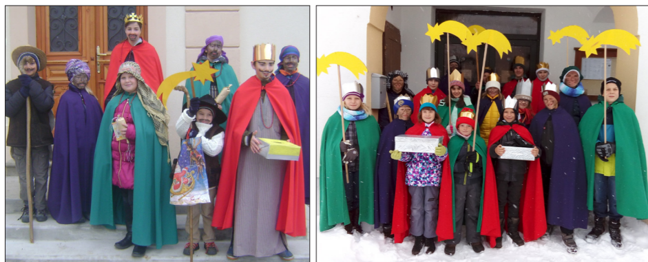
Koledniki z Blok

Skupine kolednikov so se v nedeljo, 3. 1. 2016, podale na pot oznanjevanja vesele novice. Kralji so se ustavljali po hišah na Bloški planoti in blagoslavljali prebivalce. Ljudje so jih spet ljubeznivo sprejeli in darovali za potrebe misijonarjev. Najlepša hvala vsem, ki ste dobrega in usmiljenega srca!