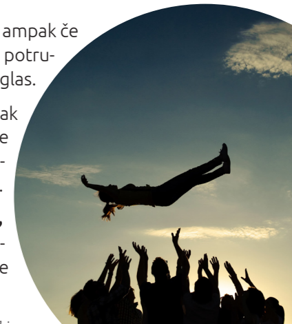
Po: Youcat – birma

Ni greh, da snujem načrte za svoje življenje , ampak če pri tem vera v Boga ni upoštevana, če me ne zanima več, da je moje življenje vsak dan v njegovi roki.