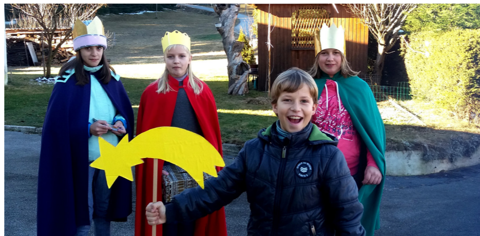
Mladi koledniki prinašajo veselo oznanilo