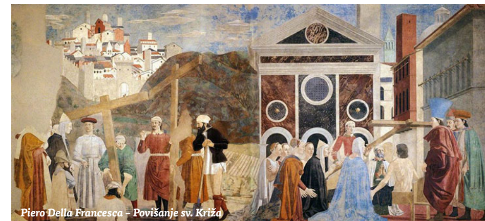
Piero Della Francesca – Povišanje sv. Križa