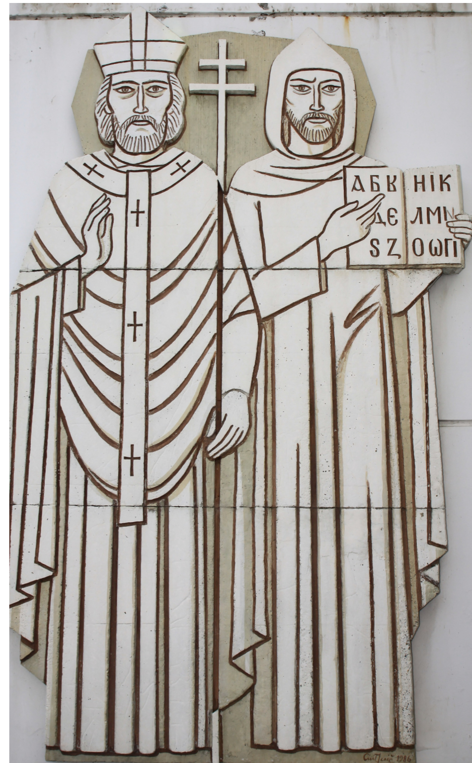
Sv. Ciril in Metod v Radencih, delo salezijanskega brata Cirila Jeriča